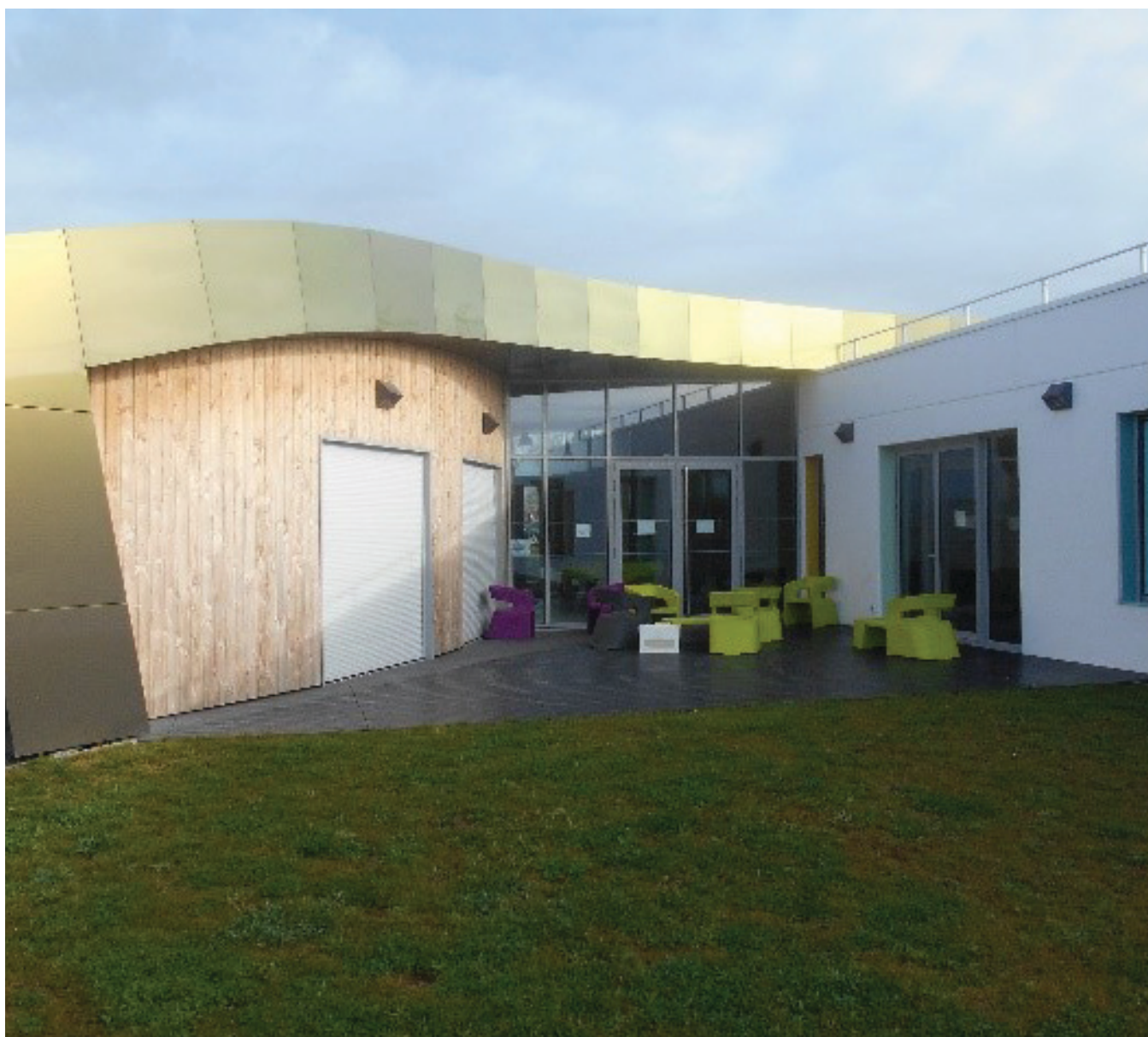
Etablissement Médico - Social ITEP - SESSAD Henri Wallon, Belleville sur Vie.